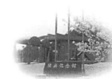
周防大島に上陸して陸奥記念館を訪問、50分ほど滞在するので、ここでしか見られない展示をたっぷり見学できる