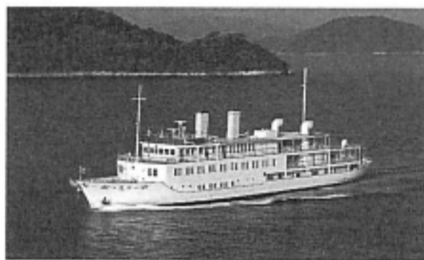
クルーズで乗船する「銀河」。通常は広島湾内でランチクルーズやディナークルーズに用いられている豪華クルーズ船だ