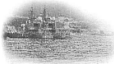
呉港を出発した「銀河」からは、海上自衛隊の呉基地の様子を一望できる。最新の護衛艦が活動する様子を間近に見られるぞ!