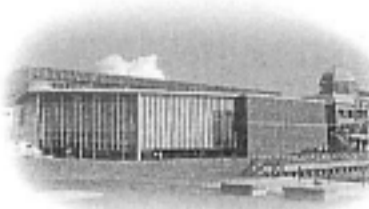
大和ミュージアムのある呉港から出発するクルーズ